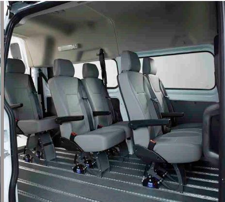
El suelo Smartfloor dota al vehículo de una gran flexibilidad a la hora de configurar el interior