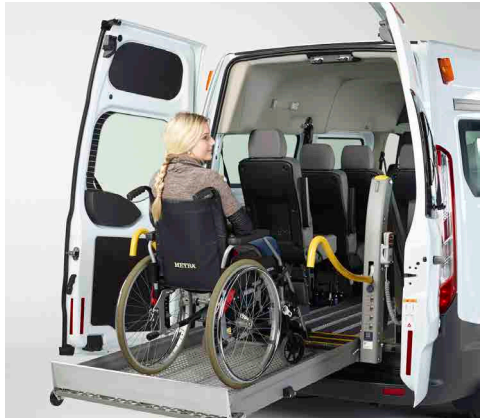
Gracias a la plataforma elevadora, se puede acceder al vehículo cómodamente en silla de ruedas