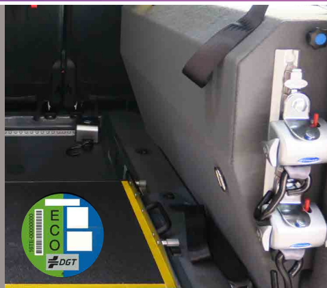
Tecnología híbrida: Depósitos GNC con 560 Kms* de autonomía y gasolina con 180 kms* de autonomía.