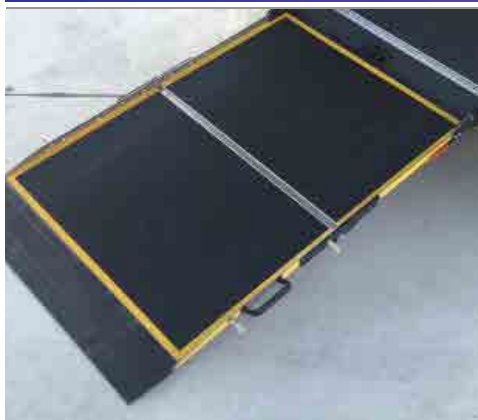
La rampa desplegable permite con gran facilidad la entrada de la silla de ruedas al vehículo