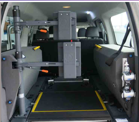
Rampa en 2 posiciones: vertical o abatida para mejorar el acceso y colocación del equipaje