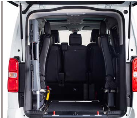
El sistema Eaxyflex permite abatir la rampa para aprovechar toda la capacidad del maletero o utilizar los 2 asientos opcionales en 3ª fila.