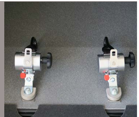
Retractor es de acero inoxidable y cinturón para cada pasajero en silla de ruedas.