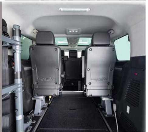
Los asientos opcionales de tercera fila , aumentan la capacidad del vehículo de 5 plazas+silla a 7 plazas.