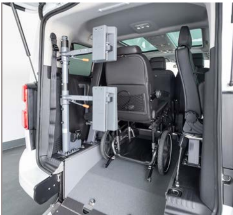
Opcionalmente, se puede equipar el vehículo con un respaldo y reposacabezas FUTURESAFE