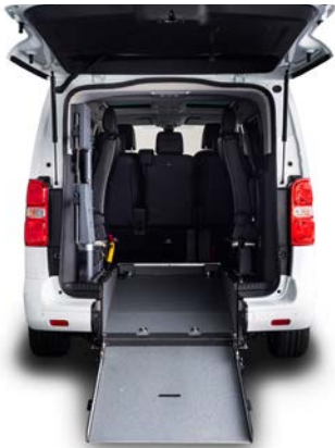
Rebaje de Piso con rampa de acceso manual. Ligera y resistente con capacidad de carga de hasta 350 Kg