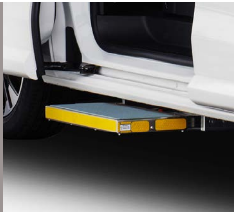
Peldaños y asideros opcionales y para vehículos del servicio público