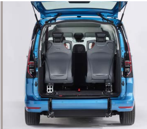
Asientos opcionales en tercera fila, para cuando no viaja el pasajero en silla de ruedas