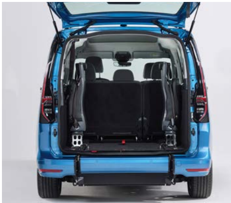
Su sistema EASYFLEX permitir abatir la rampa y aprovechar el maletero