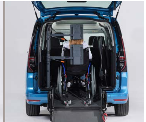
Opcionalmente, se puede equipar el vehículo con un respaldo y reposacabezas FUTURESAFE