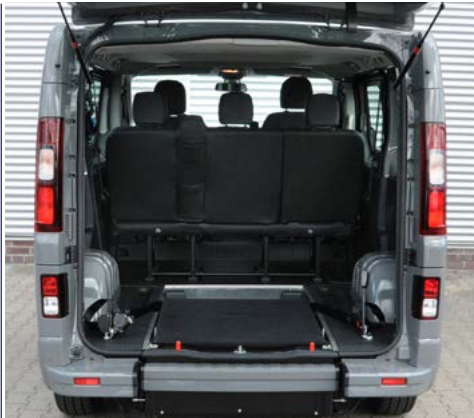
Sistema EASYFLEX para abatir la rampa y aprovechar el espacio como maletero .