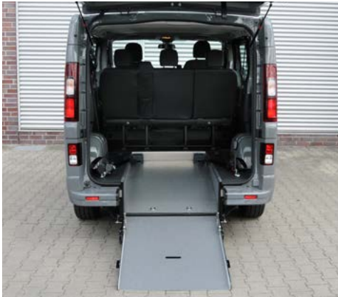
La rampa permite un acceso en silla de ruedas fácil y cómodo .