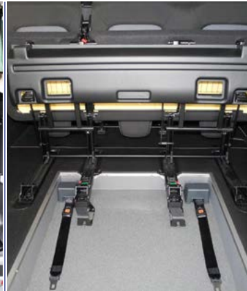
Asientos de 3ª fila abatidos para que la persona en silla de ruedas tenga su espacio.