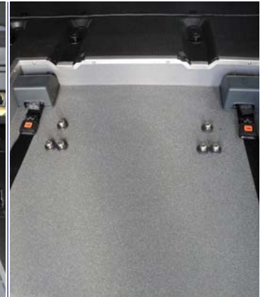
Anclajes para asientos en 3ª fila desmontables.