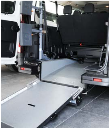
La rampa permite un acceso en silla de ruedas fácil y cómodo .