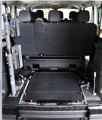
Sistema EASYFLEX para abatir la rampa y aprovechar el espacio como maletero .