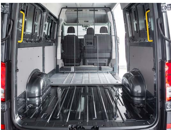
Asientos desmontables quick fix. Rejilla en posición para capacidad máxima de carga.