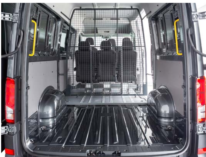
Configuración con una fila de asientos. Gran espacio de carga.