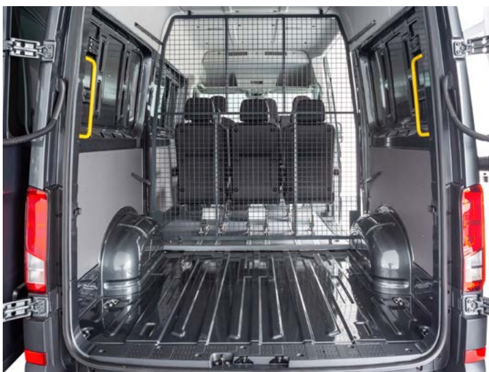
Configuración de dos filas de asientos (solo disponible para L4 y L5)