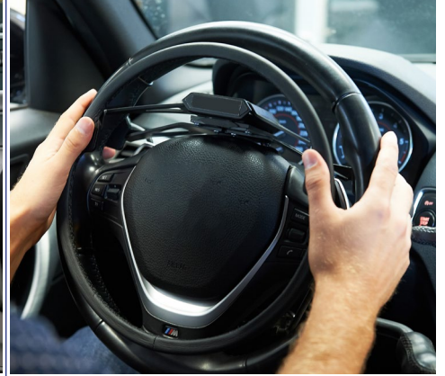
Acelerador de aro: aceleración suave por presión del aro situado en el volante.