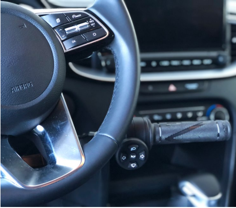
Puño moto: mando 2 en 1 que realiza una aceleración y un frenado manual.