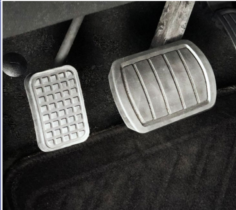
Acelerador de pie izquierdo: pedal desmontable para la aceleración.