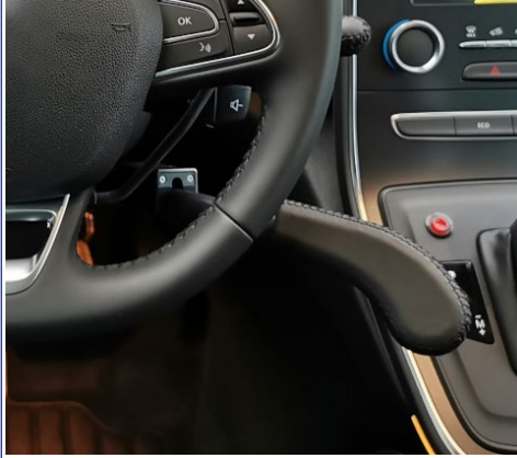
Freno al volante: frenado manual por presión horizontal sobre el mando.