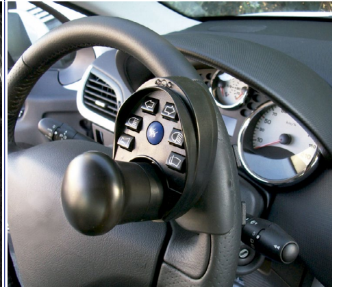
Satélite multifunción: panel que acciona hasta 12 funciones .