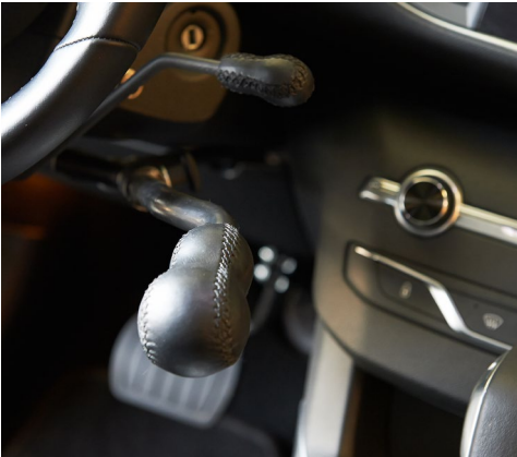
Acelerador de levas: situadas a los lados del volante. Aceleración suave.