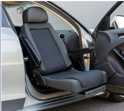
Asiento giratorio: permite la integración en el vehículo como pasajero o conductor.