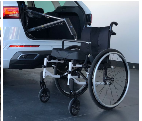
Grúa: permite introducir en el vehículo carritos y sillas de ruedas de manera sencilla.