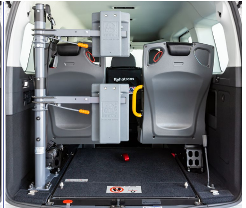
Opcionalmente, se puede equipar el vehículo con un respaldo y reposacabezas FUTURESAFE .