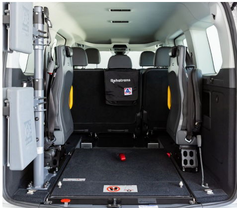
Su sistema EASYFLEX permite abatir la rampa y aprovechar el maletero.