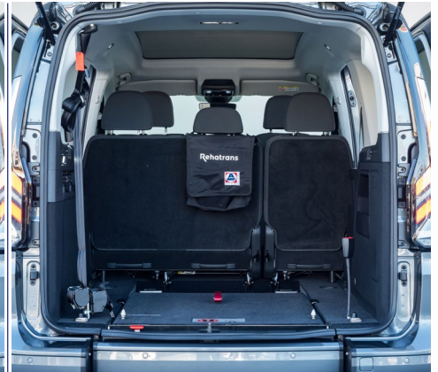
Su sistema EASYFLEX permite abatir la rampa y aprovechar el maletero.