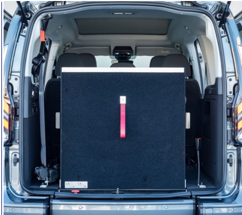
Función EASYUSE : para operar con mayor facilidad y menos esfuerzo.