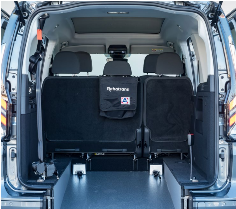
Gran rebaje sin renunciar a nada