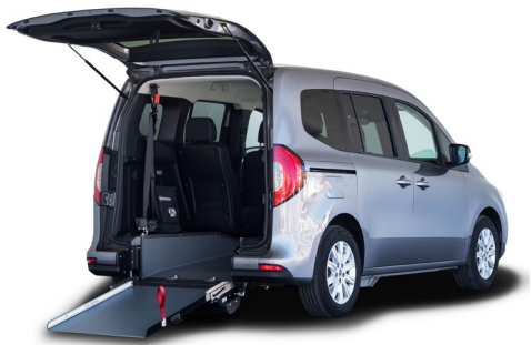
Rebaje de piso con rampa de acceso manual. Ligera y resistente con capacidad de carga de hasta 350 Kg.