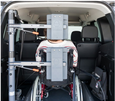
Opcional: respaldo y reposacabezas FUTURESAFE disponible.