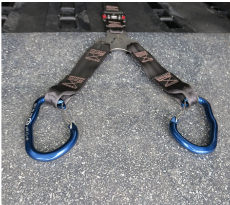
Opcional: dispositivo de ayuda para subir la silla y a su ocupante: CABESTRANTE F-WINCH