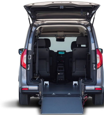
La configuración de 4 plazas, permite al pasajero en silla viajar más integrado con el resto de viajeros