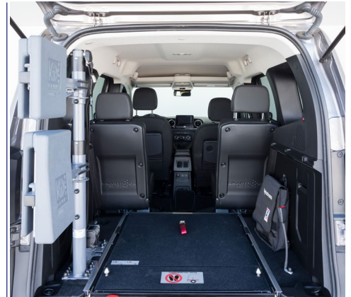
El sistema Easyflex permite abatir la rampa para aprovechar toda la capacidad del maletero, cuando no viaja el pasajero en silla.