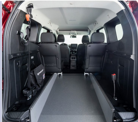
El sistema Easyflex permite abatir la rampa para aprovechar toda la capacidad del maletero, cuando no viaja el pasajero en silla.