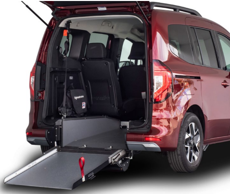
Rebaje de piso con rampa de acceso manual. Ligera y resistente con capacidad de carga de hasta 350 Kg.