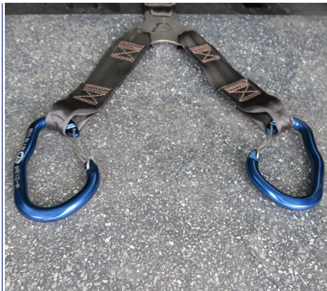
Opcional: dispositivo de ayuda para subir la silla y a su ocupante: CABESTRANTE F-WINCH