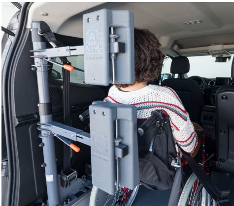
Opcional: respaldo y reposacabezas FUTURESAFE disponible.