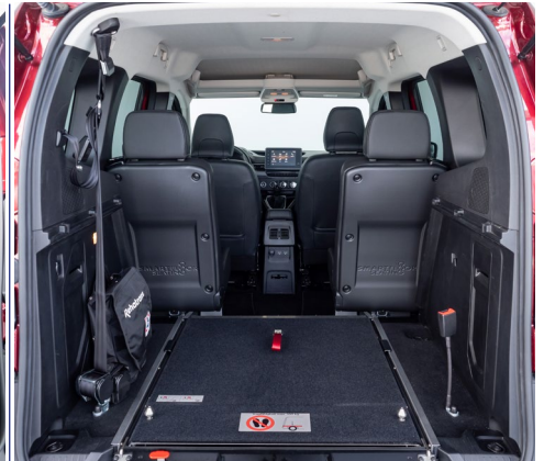
La configuración de 4 plazas, permite al pasajero en silla viajar más integrado con el resto de viajeros