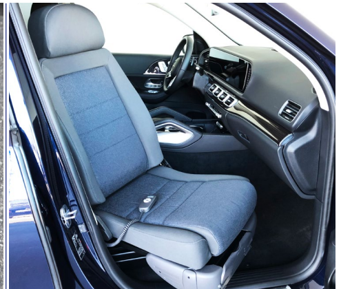
Opcional: asiento del copiloto giratorio para tener más opciones de viajar.